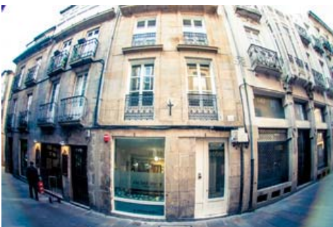
Albergue The Last Stamp