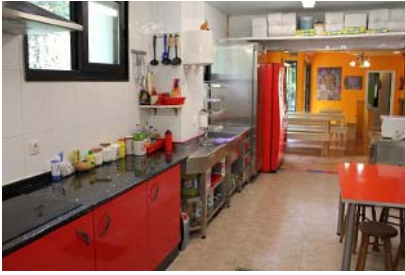
Albergue Acuario de Santiago de Compostela