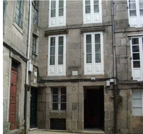
Albergue O Fogar de Teodomiro