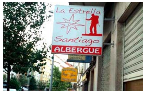
Albergue La Estrella de Santiago