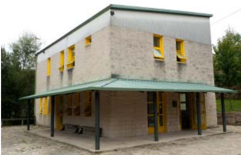
Albergue de peregrinos de Teo