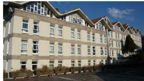
Albergue Turístico La Salle