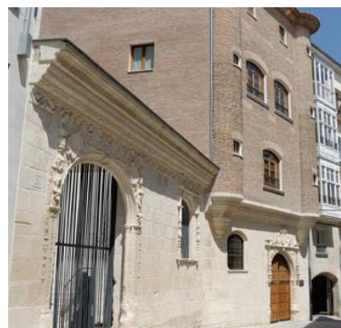
Albergue Municipal de Burgos