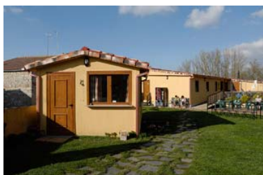
Albergue El Peregrino