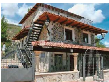
Albergue Vía Minera