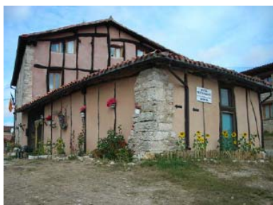
Albergue La Hutte