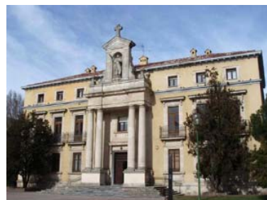
Casa de Peregrinos Emaús